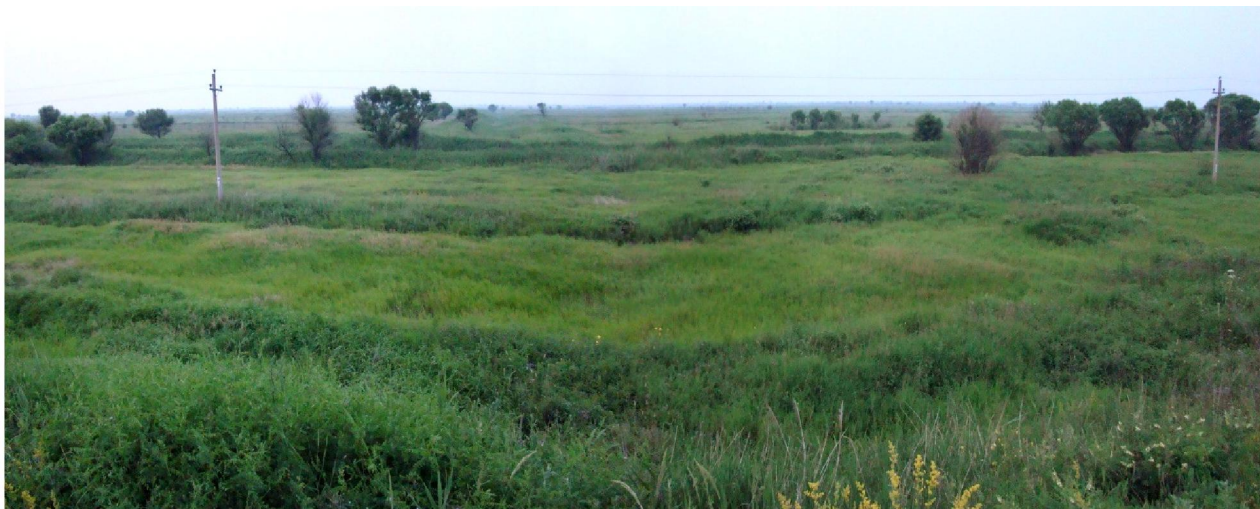
Рис. 2. Участок обитания сибирской пестрогрудки Tribura tacsanowskia на Приханкайской низменности (долина среднего течения Мельгуновки, 7 июля 2012).

и более. Песня сибирской пестрогрудки была на тот момент нам уже хорошо знакома по записи с грампластинки (Наумов, Вепринцев 1973) и наблюдению этой птицы в природе (Волковская-Курдюкова, Курдюков 2012). Она настолько характерна, что, в отличие от внешнего облика, считается наиболее надёжным признаком при полевом определении вида (Kennerley, Pearson 2010).